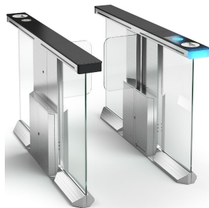
<ゲート> 【GSG】 顔・二次元コードで通行可能