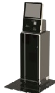
<無人受付機> 二次元チケット発行