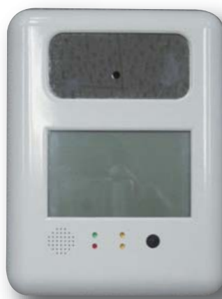
CRU-4000と顔認証用カメラ