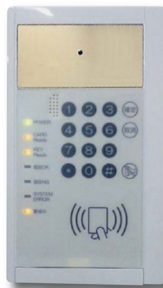
CRU-1000と顔認証用カメラ